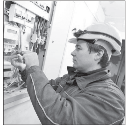
ктропостачання в будинках за адресами: вул. Чайковського, 21 (I та II під'їзди) та вул. Келецька, 162 (I, II та III під'їзди).