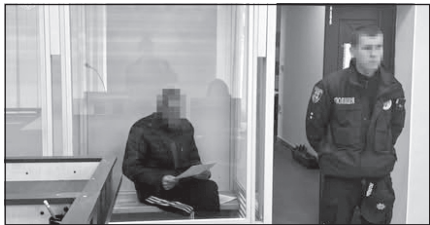
У Вінницькому районі правоохоронці затримали 42-річного чоловіка, якого підозрюють у багаторічному сексуальному насильстві над 13-річною падчеркою.

За процесуального керівництва прокурорів Немирівської окружної прокуратури йому вже повідомлено про підозру у гвалтуванні малолітньої падчерки (ч. 4, 6 ст. 152 КК України). Це