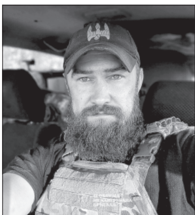
Бойовий шлях офіцера 41 окремої механізованої бригади із позивним «Дев'ятка», який родом з Вінниччини, розпочався ще у 2014 році у складі першої штурмової роти добровольчого батальйону «Донбас-Україна». З того часу його філософією на усе життя стали принципи: «Коли за нами прийде Бог — ми потиснем йому руку» та «Якщо не ми — то хто?».

Історію Захисника опублікували на сторінці 41 окремої механізованої бригади.