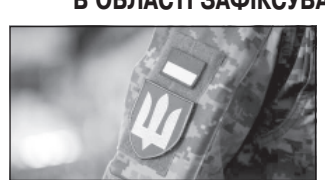
Станом на 12 квітня в області за час повномасштабного вторгнення зафіксовано 16 випадків нападів на ТЦК. Загалом по Україні зафіксовано 620 інцидентів з нападами на військових ТЦК.

Про це повідомляє Київський обласний ТЦК та СП.