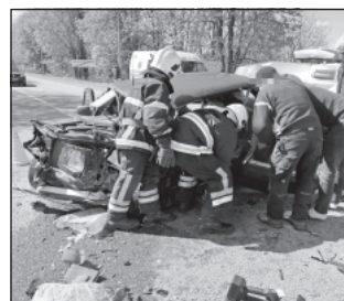
19 квітня сталася дорожно-транспортна пригода поблизу села Краснопілка Гайсинського району. Зіткнулися легковик, автобус та вантажівка. З понівеченого авто діставали водія та пасажирку.

Про це повідомляють рятувальники Вінниччини.