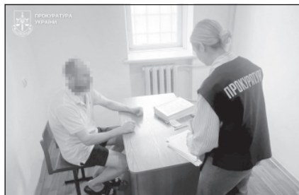
Вітчим залякував та гвалтував 14-річну доньку співмешканки у Хмельницькому рай-

оні. Дівчина наважилася розповісти матері після того, як зрозуміла, що завагітніла. Про це повідомляють у Офісі Генерального прокурора.