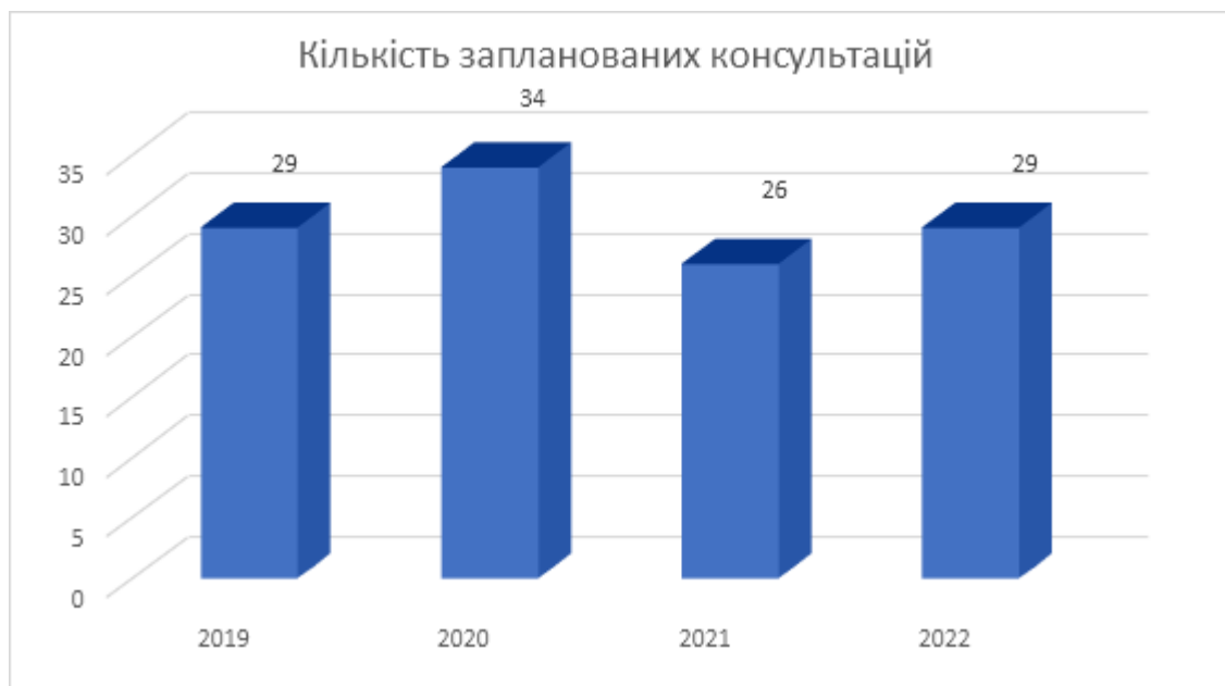
Рисунок 1. Кількість запланованих консультацій з громадськістю протягом 2019-2021 рр.

План консультацій з громадськістю на 2019 рік складався з 29 пунктів, на 2020 рік – 34, на 2021 рік – 26, на 2022 рік – 29 (рис. 1).