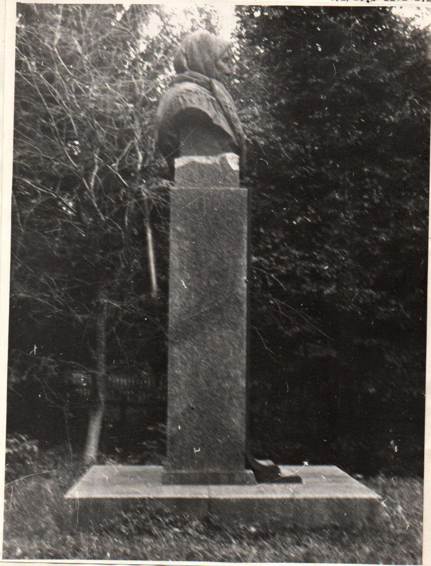
Пам"ятник двічі Герою Соціалістичної Праці Т.П.Марчин Відкритий в 1962 р. Вінницька область, Крижопільський р-н, с.Голубече Фот. Слободянк В.С., 1974 р.