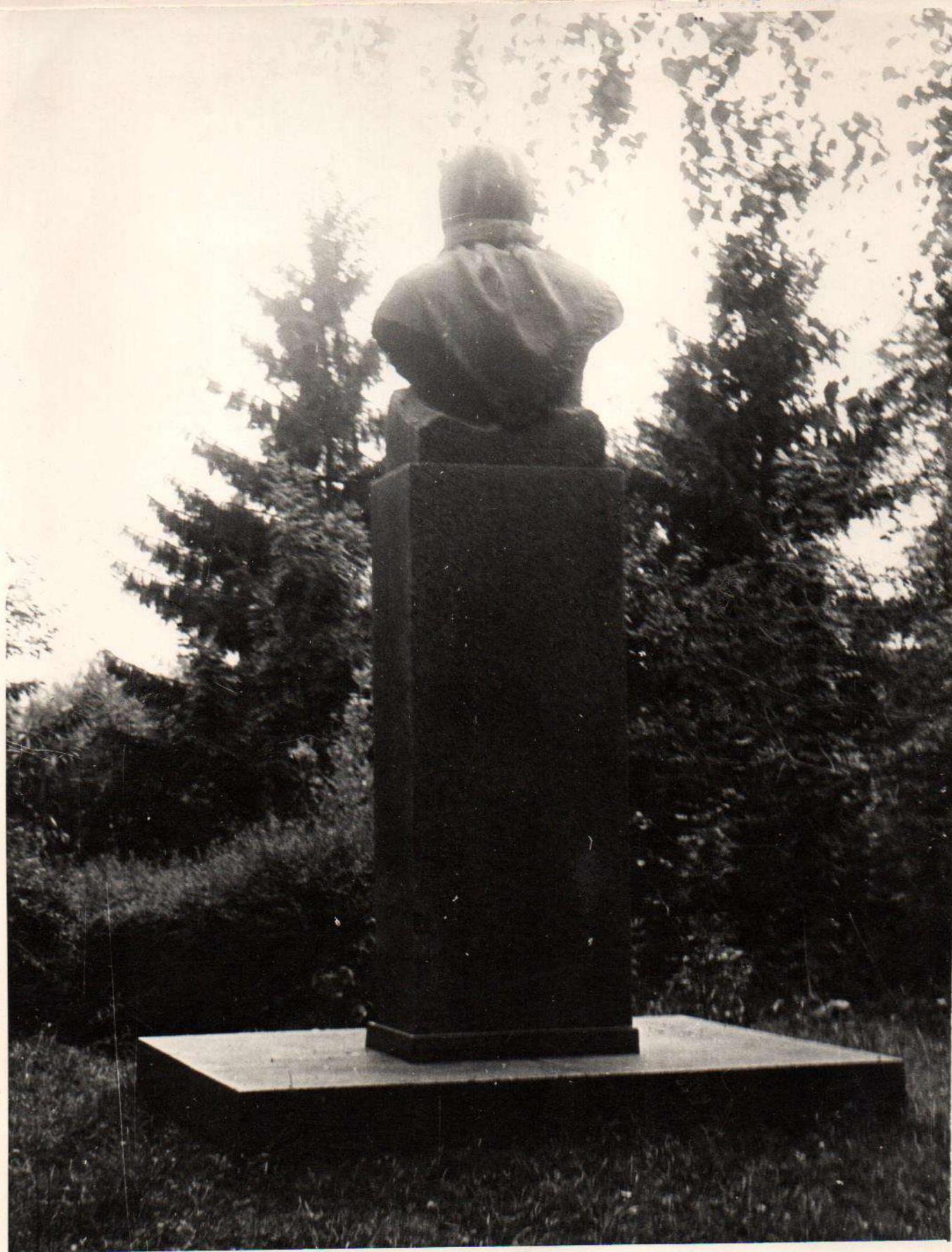
Пам"ятник Т. П. Марцин Відкритий в 1962 р. Вінницька область, Крижопільський район, с. Голубече 1974 р.