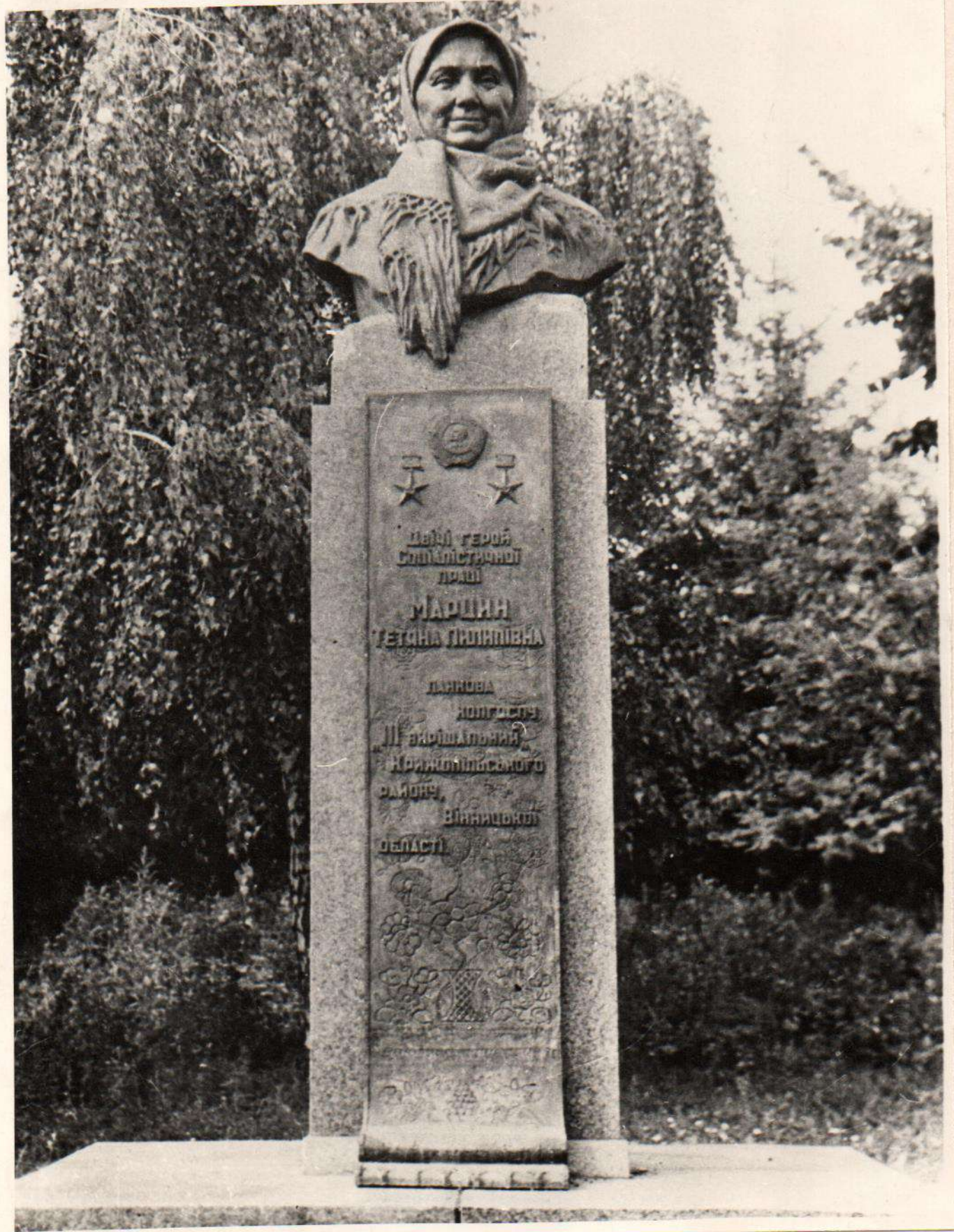
Пам"ятник Т.П.Марцин Відкритий в 1962 р. Вінницька область, Крижопільський район, с.Голубече 1974 р.