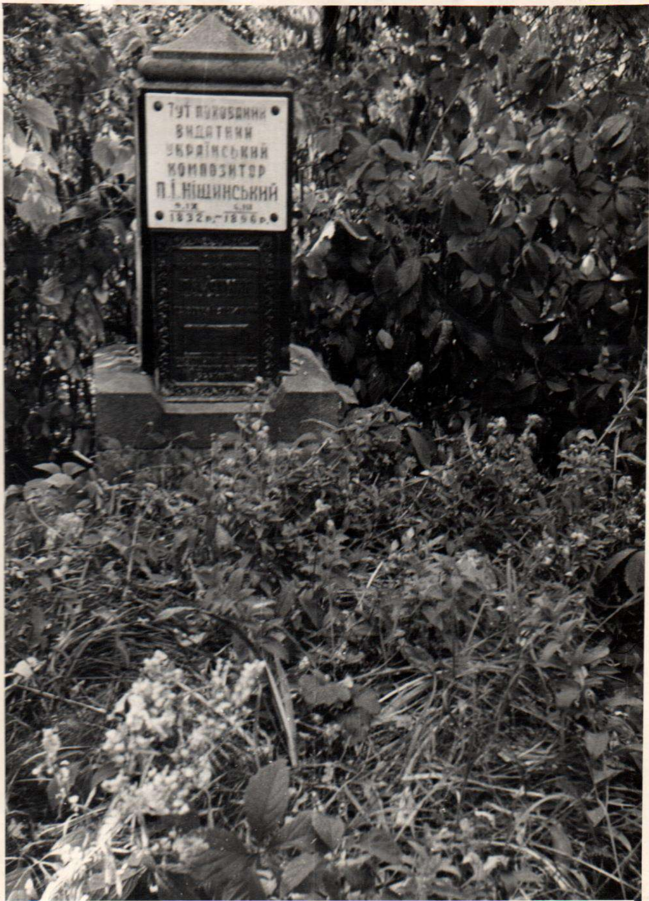
Могила П.І.Нішинського. Пам"ятник на могилі встановлений в 1952 р. Вінницька обл., Тиврівський р-н, с.Ворошилівка.