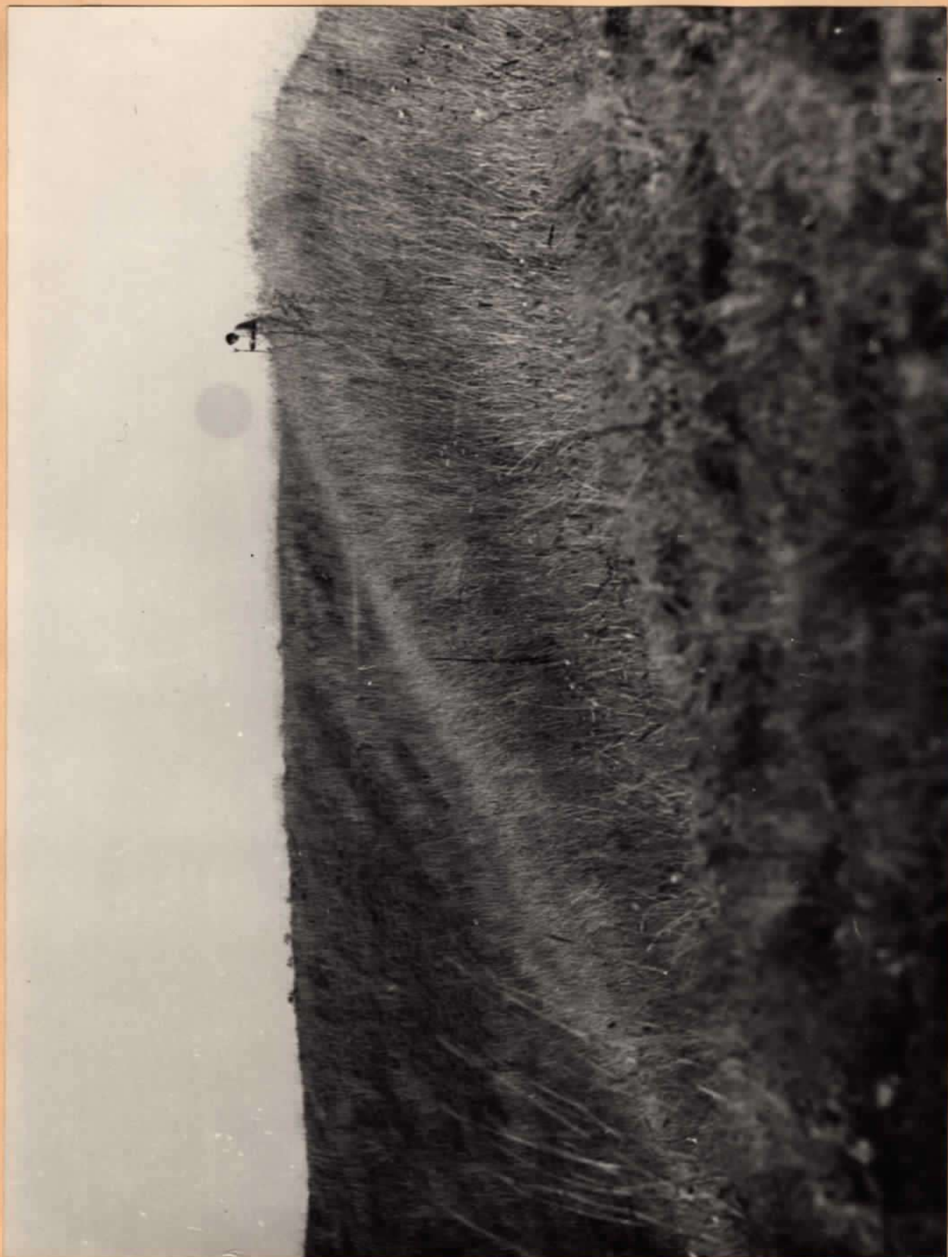
Скіфське городище УІІ - ІІІ ст.ст. до н.е. /фрагмент валу/ Вінницька обл., Мурованокуриловецький р-н, с.Дерешова