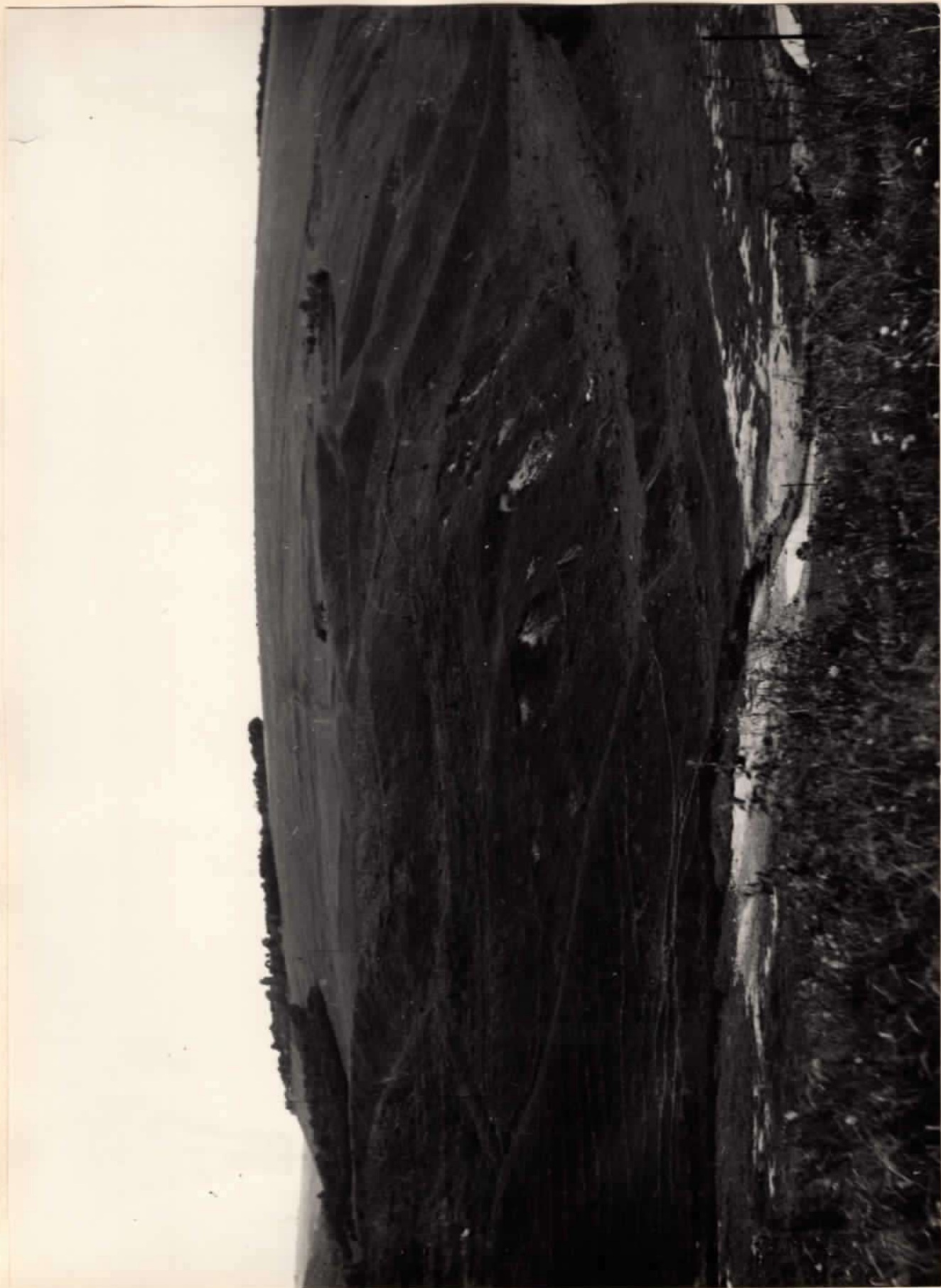
Скіфське городище УІІ - ІІІ ст.ст. до н.е./загальний вигляд/ Вінницька обл., Мурованокуриловецький р-н, с.Дерешова Фото Слободянк В.С. 1974 р.