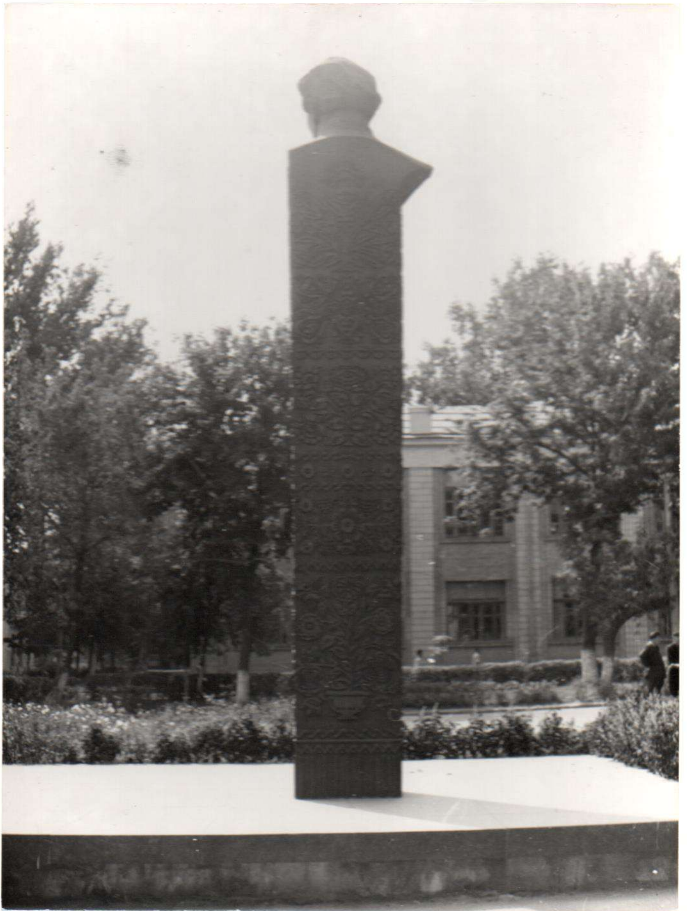
Пам"ятник М.Д.Леснотвичу Встановлений в 1969 р. Скульптор - Г.Н.Кальченко Вінницька обл., Гульчинський р-н, м.Тульчин 1974 р.