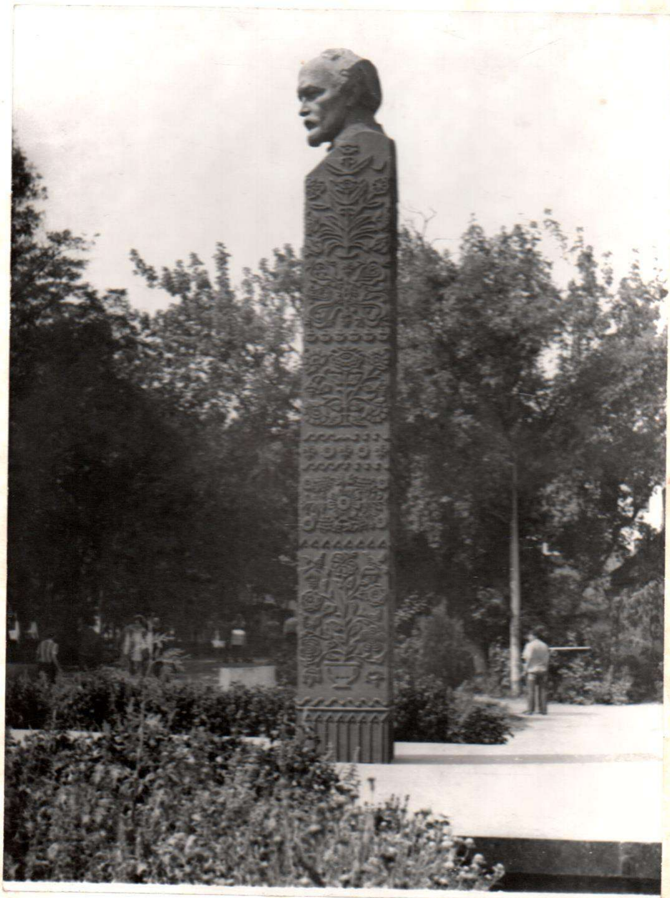
Пам"ятник М.Д.Леонтовичу Встановлений в 1969 р. Скульптор - Г.Н.Кальченко Вінницька обл., Тульчинський р-н, м.Тульчин