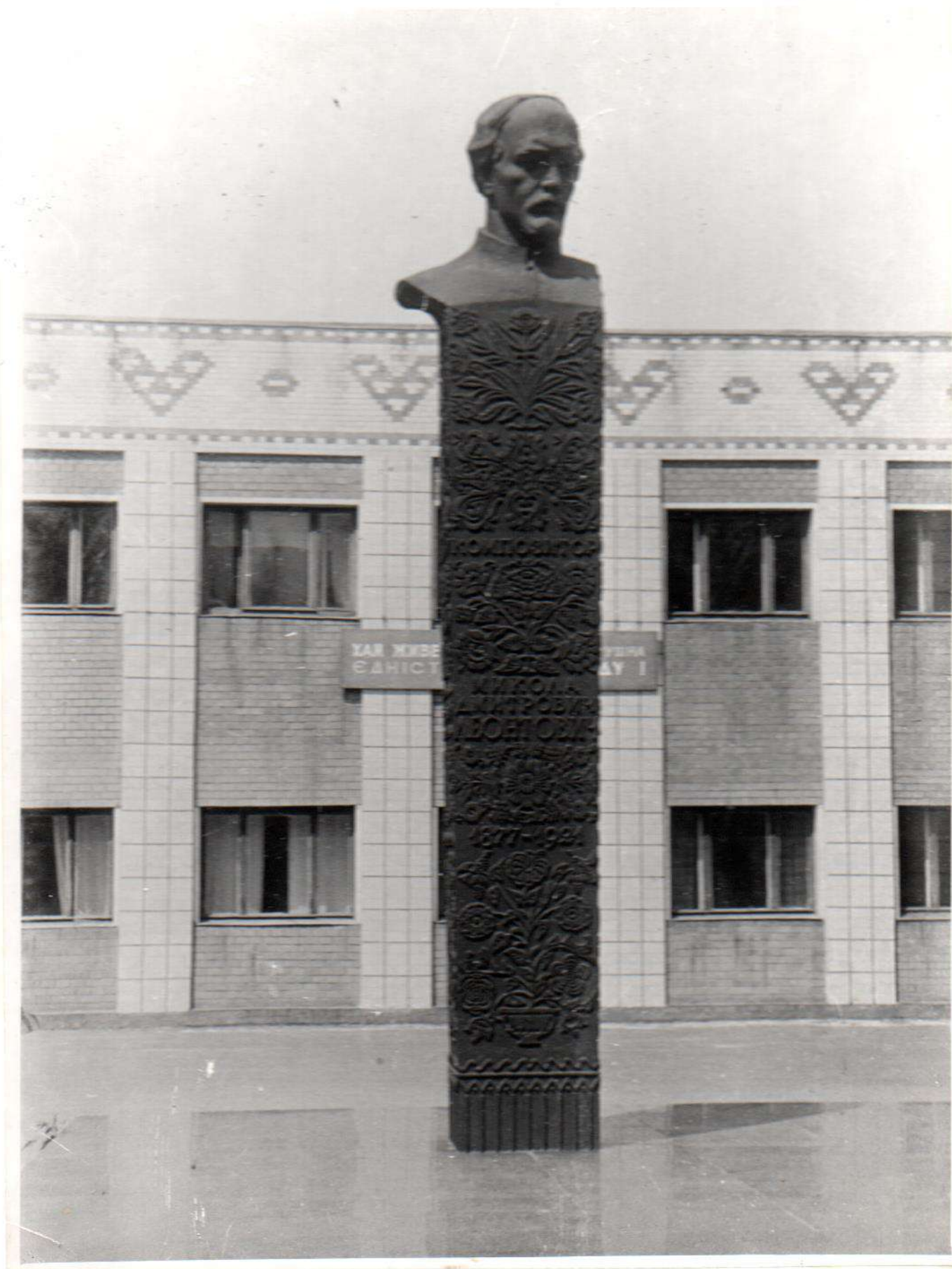
Пам'ятник М.Д.Леонтовичу Встановлений в 1969 р. Скульптор - Г.Н.Кальченко Вінницька обл., Гульчинський р-н, м.Гульчин