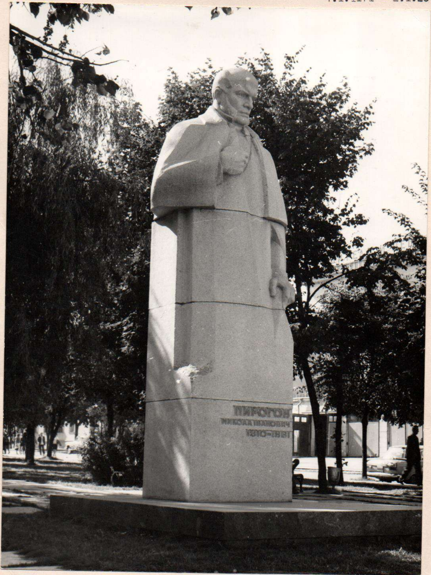
Пам"ятник М.І.широгову Відкритий в 1971 р. Вінницька область, м.Вінниця