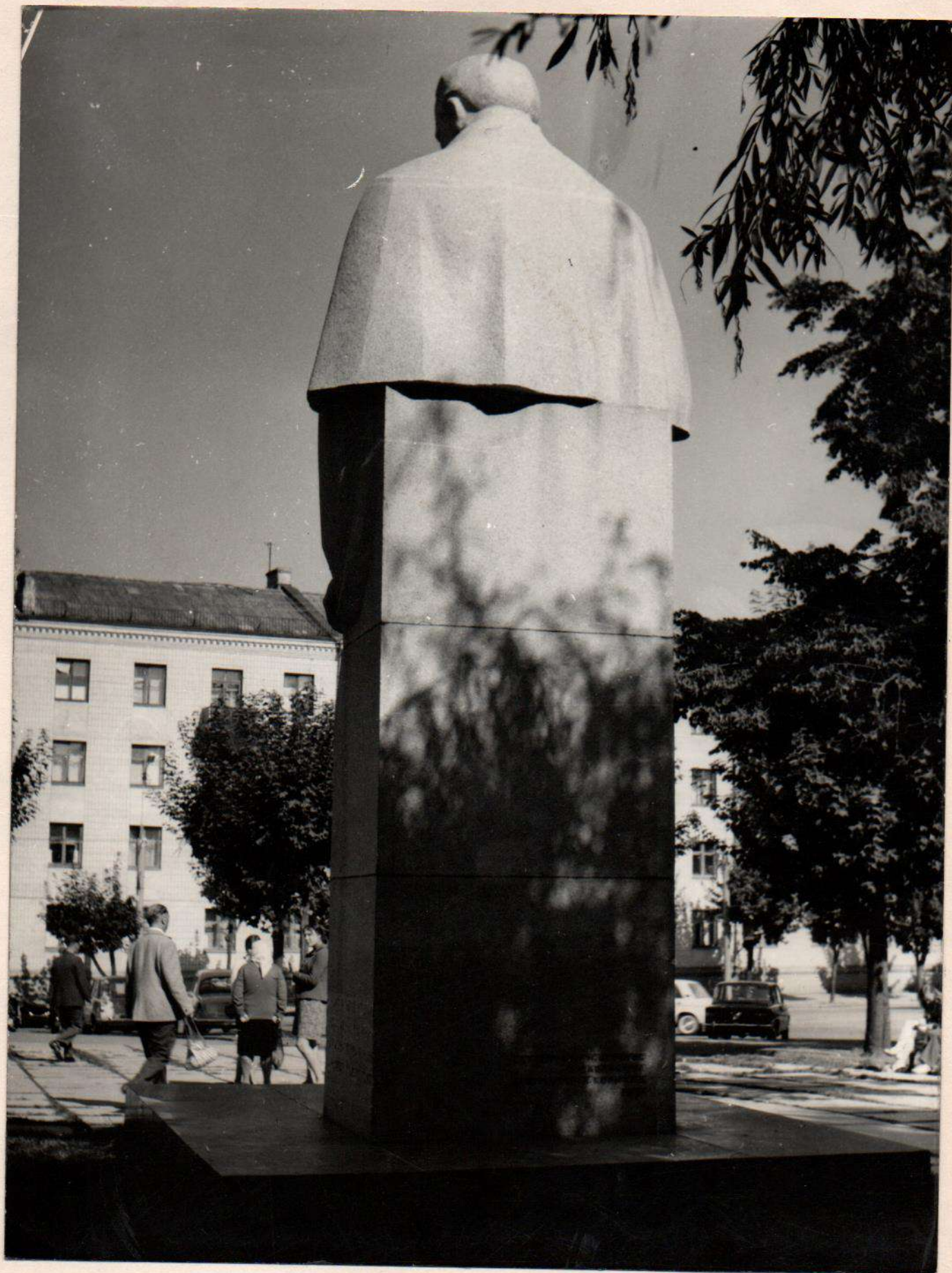
Пам"ятник М.І.Пирогову Відкритий в 1971 р. Вінницька область, м.Вінниця