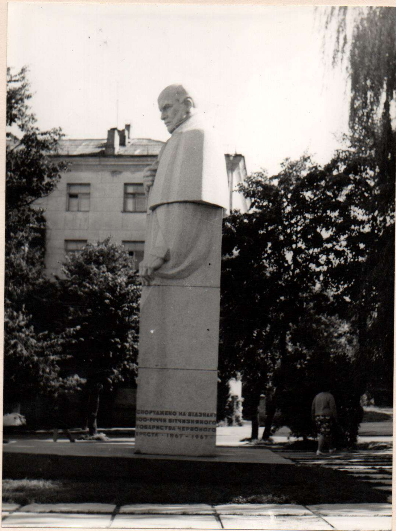
Пам'ятник М.І.Пирогову Відкритий в 1971 р. Вінницька область, м.Вінниця