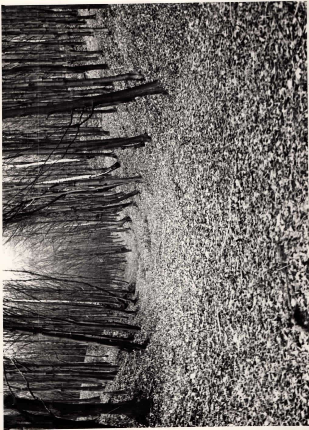
Скіфське городище УП - У ст.ст. до н.е./фрагмент валу/ Вінницька обл., Вінницький р-н, с.Якушинці.