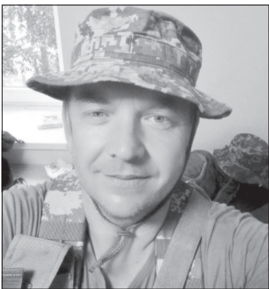
Наразі військовий — головний сержант першого стрілецького взводу 3

Військовослужбовець з Вінниччини з позивним «Шурік», до тероборони пішов добровольцем на початку повномасштабного вторгнення росії в Україну. За освітою він учитель, 19 років присвятив школі, а останнім часом змінив діяльність і працював перевізником.