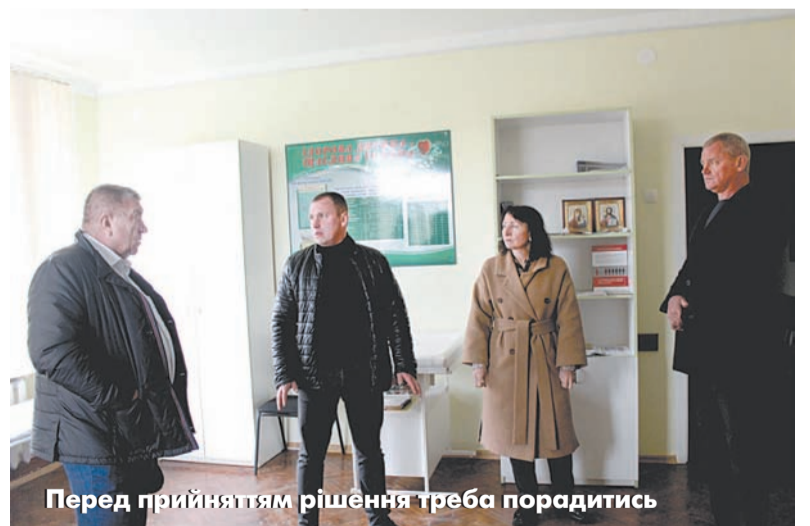
Перед прийняттям рішення треба порадитись

- Комунальному підприємству «Іллінецьводоканал» міської ради закуплено два генератори потуж-