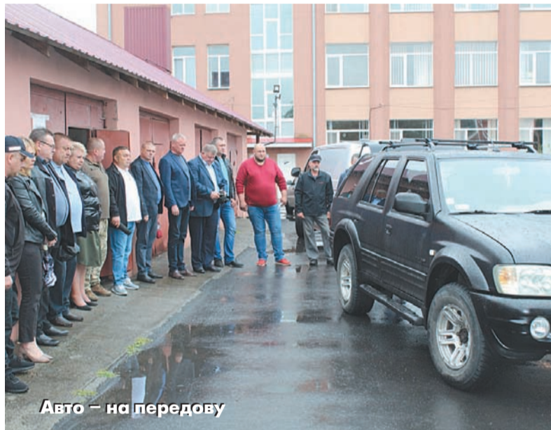
Авто — на передову

- Звичайно, з початком повномасштабної війни Іллінець і інші населені пункти вже не виглядали і не могли виглядати так, як цього. Бо на першому плані питання, про які йшлося вище. Але з іншого боку, все повинно функціонувати належним чином. Люди не мають опускати руки, а навпаки — ходити на роботу, отримувати зарплату, сплачувати податки, утримувати помешкання й прилеглу територію в належному стані. Ніщо не має нас пригнічувати й викликати невпевне-