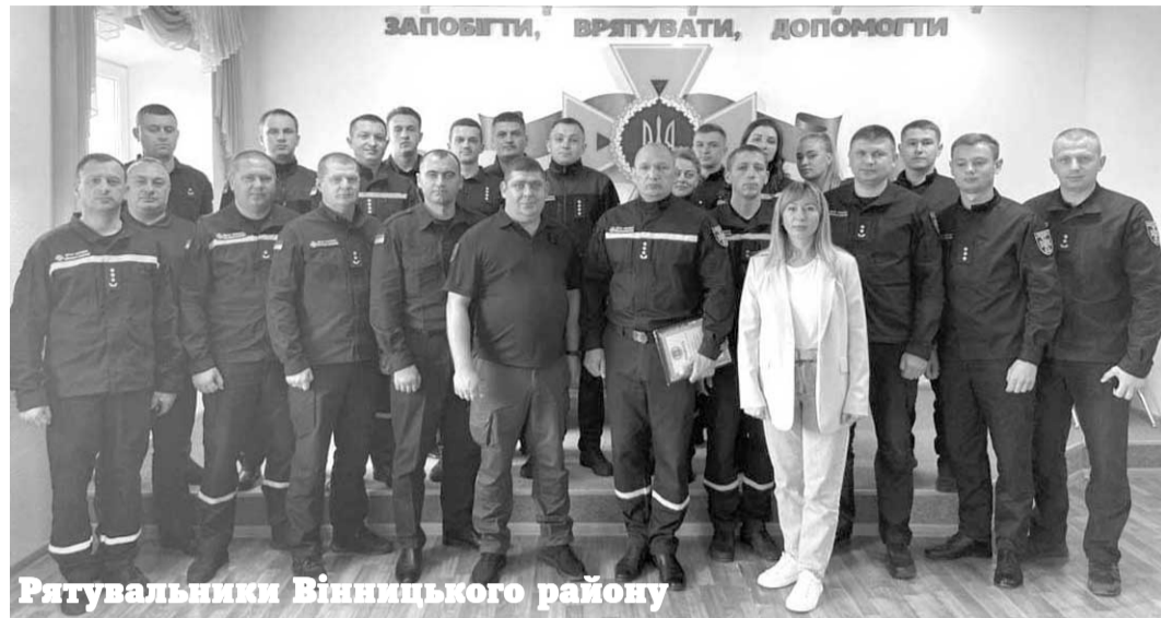
Рятувальники Вінницького району